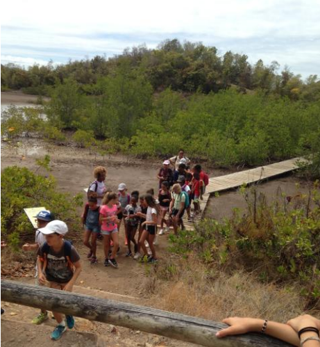
11 avril à la Caravelle