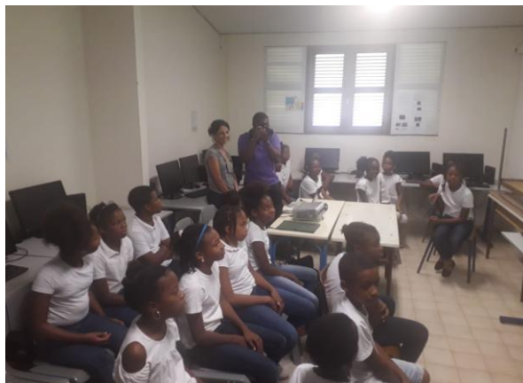
6 juin Ducos