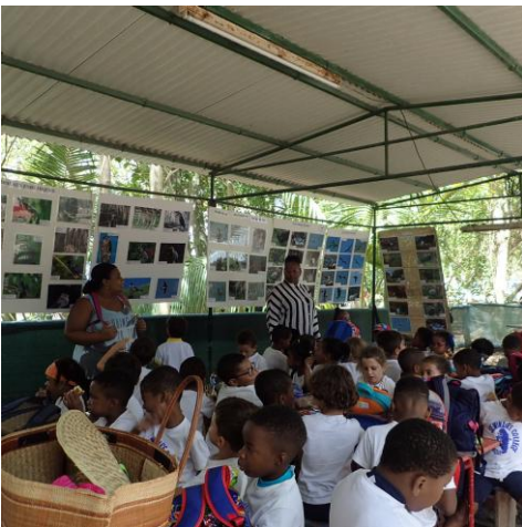
4 avril Sainte Anne